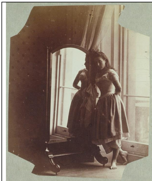
Lady Hawarden (Clementina Maude), Young Girl With Reflection , 1863-64, V&A, London.

2. 請在以下兩張攝影作品中 擇一 為例，討論此作品在藝術史上的重要性和影像意涵。（20%）